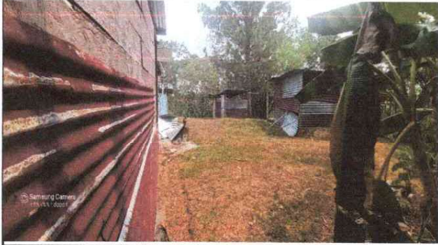
Foto1: SUSTITUCION DE PARED DE MADERA POR PARED DE BLOCK