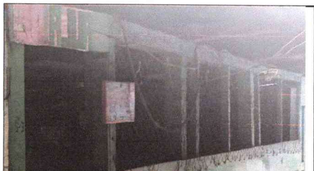
Foto 4: SUSTITUCION DE VENTANAS DE MADERA POR VENTANAS DE METAL CON VIDRIOS.